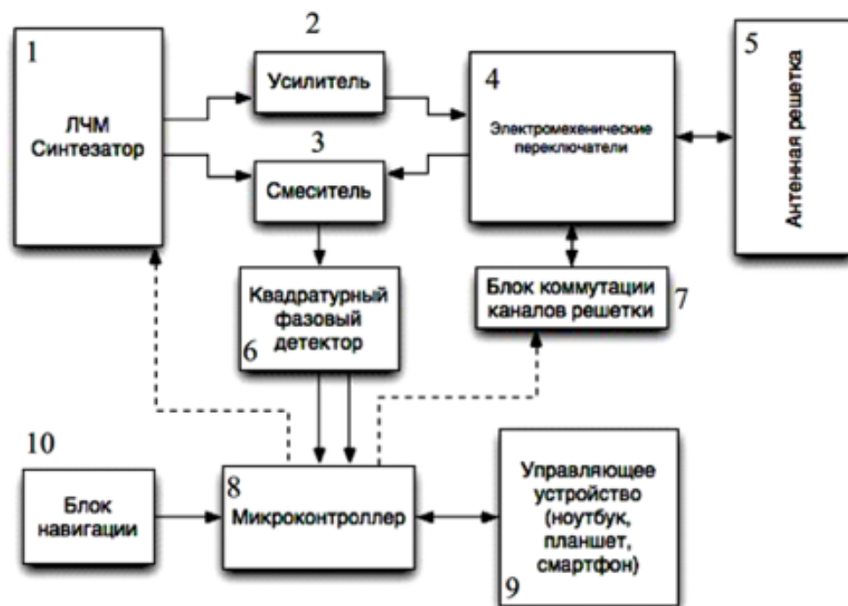
Рис. 1. Блок схема устройства